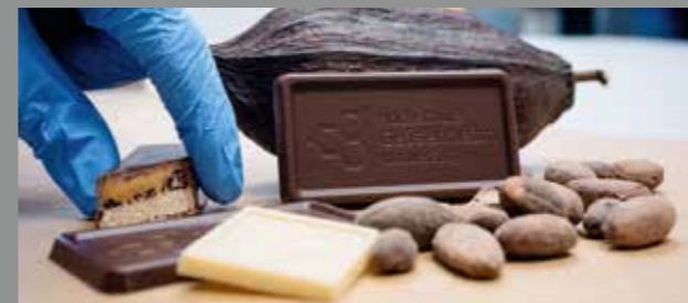
© Titel: Hessen schafft Wissen / Steffen Böttcher